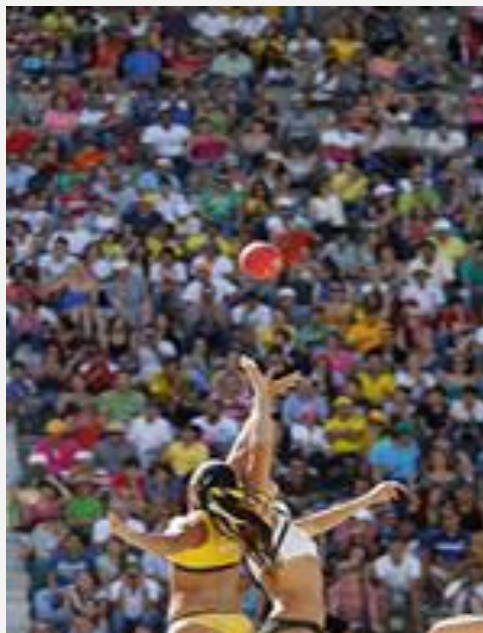
Priscilla Annes no tiro de árbitro pelo Brasil

Assimetria ataque x defesa: Se na quadra jogam 6 x 6 na linha, na areia o goleiro sempre vai ao ataque, proporcionando um ataque de 4 jogadores contra 3 defensores. Esse jogador que vai ao ataque vestido como goleiro é conhecido como especialista ou curinga.